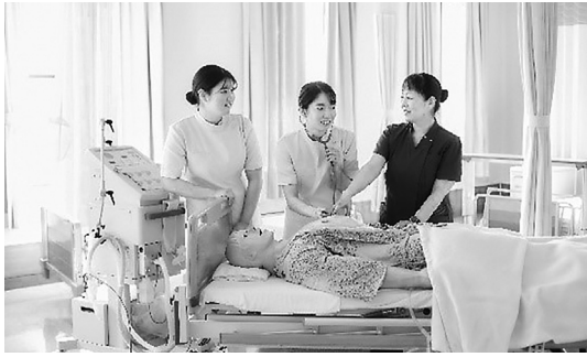
大和大学白鳳短期大学部