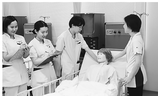
南奈良看護専門学校