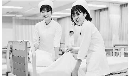
阪奈中央看護専門学校