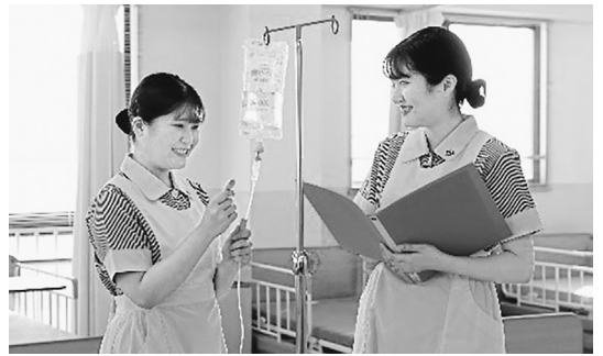
関西学研医療福祉学院