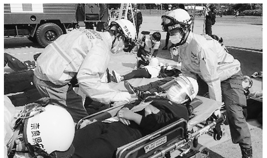
奈良県病院協会看護専門学校