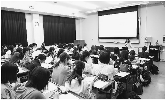
奈良県立医科大学