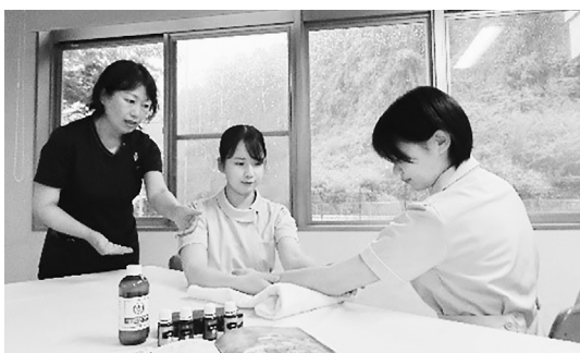
ハートランドしぎさん看護専門学校