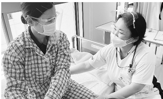
奈良市立看護専門学校