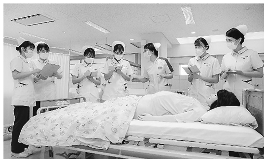
奈良県医師会看護専門学校